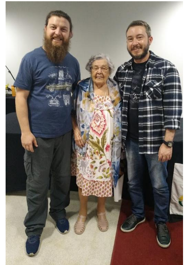
As orientações seguiram até 2017